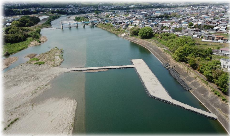
紀の川小田地区護岸補修工事