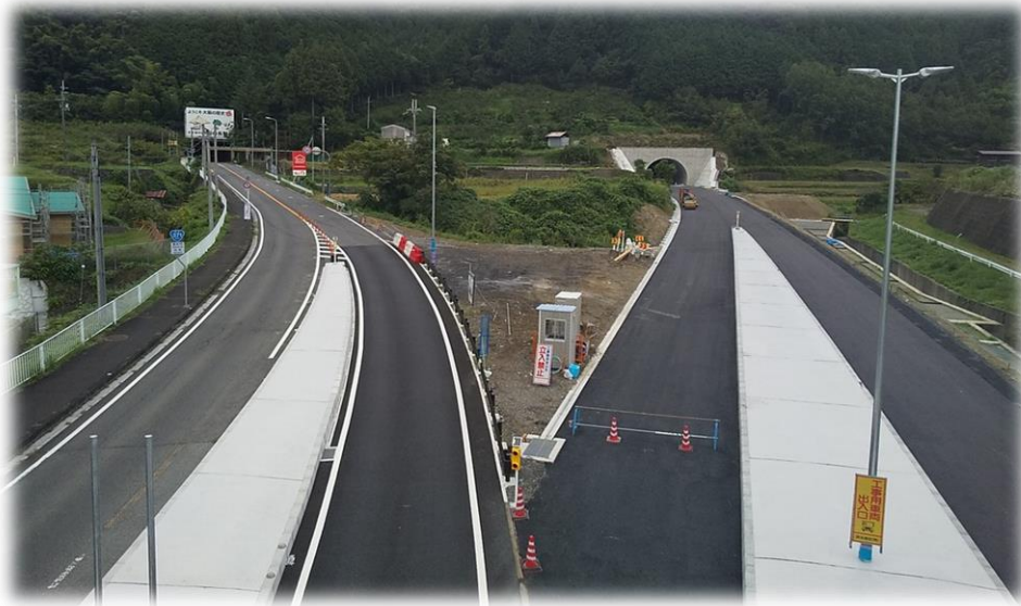
国道371号道路改良工事