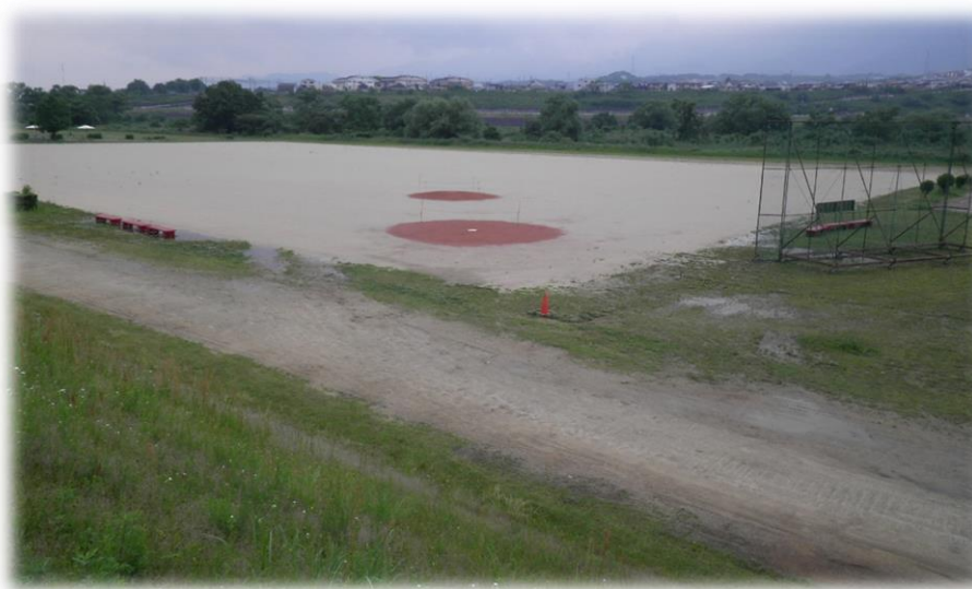
南馬場緑地広場グラウンド整備工事