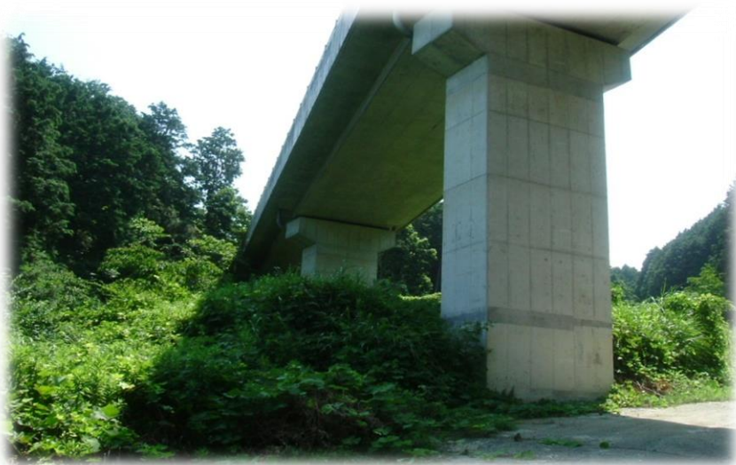
紀の川左岸地区 橋本5号橋下部工事