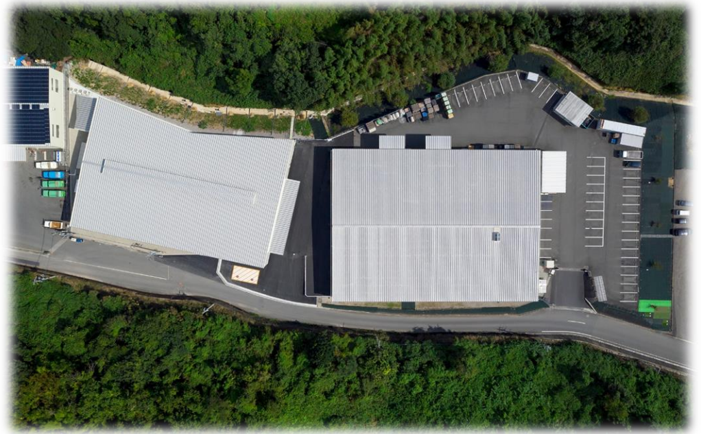
縁 橋本店新装工事