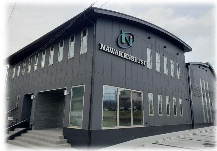
奈和建设(株) 事務所増築工事