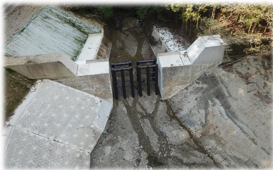
米の郷谷川砂防(砂防)工事