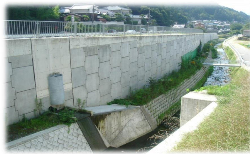
市道清水西畑線橋梁下部工事