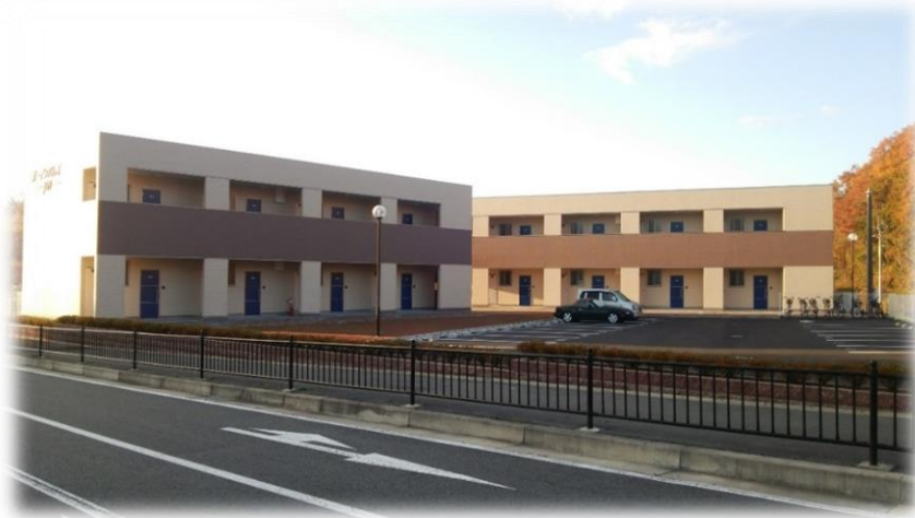
ガーデンパレスJIN新築工事