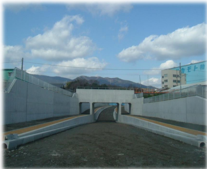
山田岸上線道路改良工事